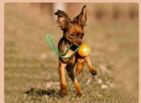
Russische Toy Terriër, langhaar