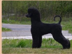
Grote Poedel, zwart, wit, bruin