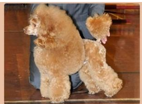
Middenslag Poedel, grijs, abrikoos, rood