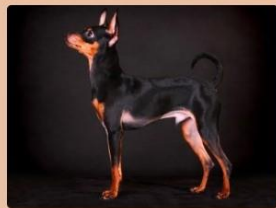
Russische Toy Terriër, korthaar