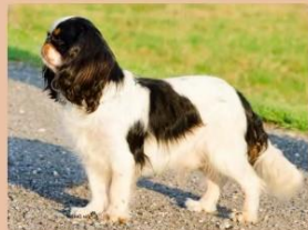
King Charles Spaniël