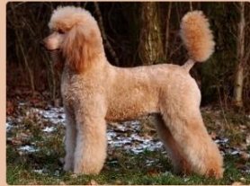
Grote Poedel, grijs, abrikoos, rood