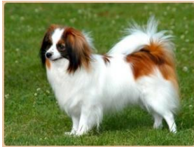
Epagneul Nain Continental, Phalène