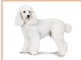
Middenslag Poedel, zwart, wit, bruin